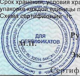
Схема сертификации: ТС

Срок хранения, условия хранения указаны в прилагаемой к продукции товаросопроводительной документации и/или на упаковке каждой единицы продукции.